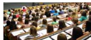
Veranstaltungen in der Region

Teksty nie podpisane nazwiskami są artykułami zespołu Słubicko-Frankfurckiego Centrum Kooperacji. Zdjęcia zostały udostępnione przez instytucje wymienione w newsletterze lub przez Słubicko-Frankfurckie Centrum Kooperacji.